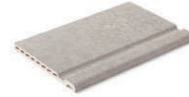
Borde Maui · Maui edge