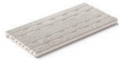
Rejilla de drenaje RJ25 · Drain grate RJ25