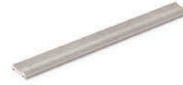
Media caña interior Inner trim