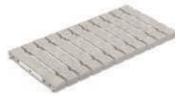
Rejilla de drenaje RJ25 FLEX · Drain grate RJ25 FLEX

Goma para rejilla 9710 incluida Grate rubber 9710 included