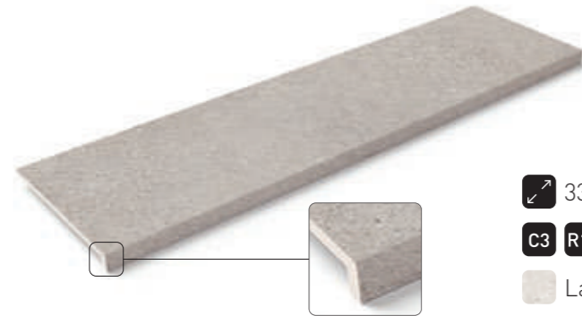
Peldaño recto · Recto step