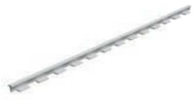
Goma para rejilla 9710 · Grate rubber 9710

Goma para rejilla 9710 incluida Grate rubber 9710 included