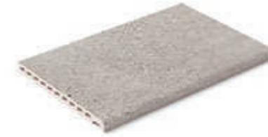
Borde Creta · Creta edge