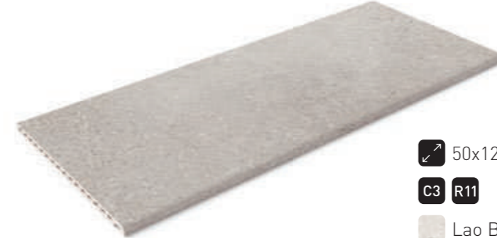
Borde Samoa · Samoa edge