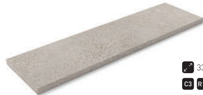
Peldaño recto tapa · Recto step corner